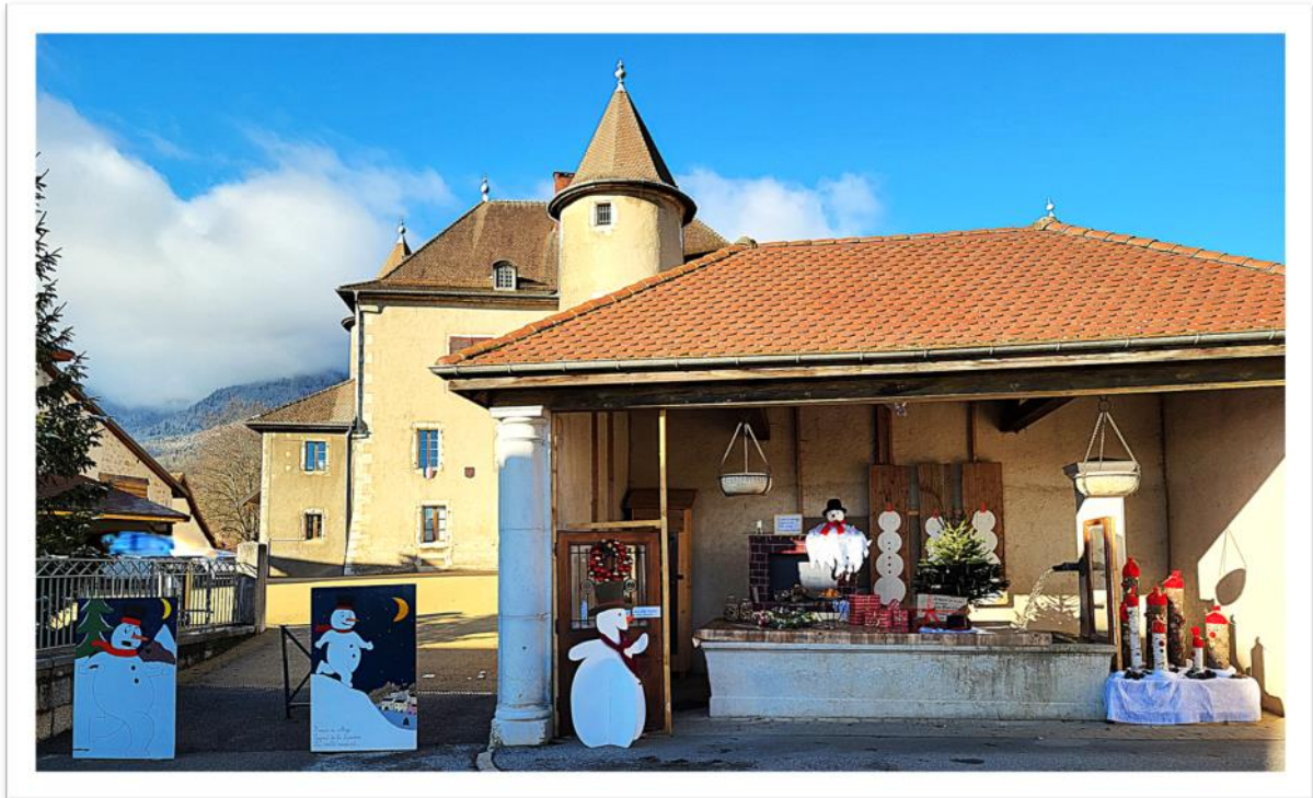
« Le bonhomme de neige » de Jacques Prévert